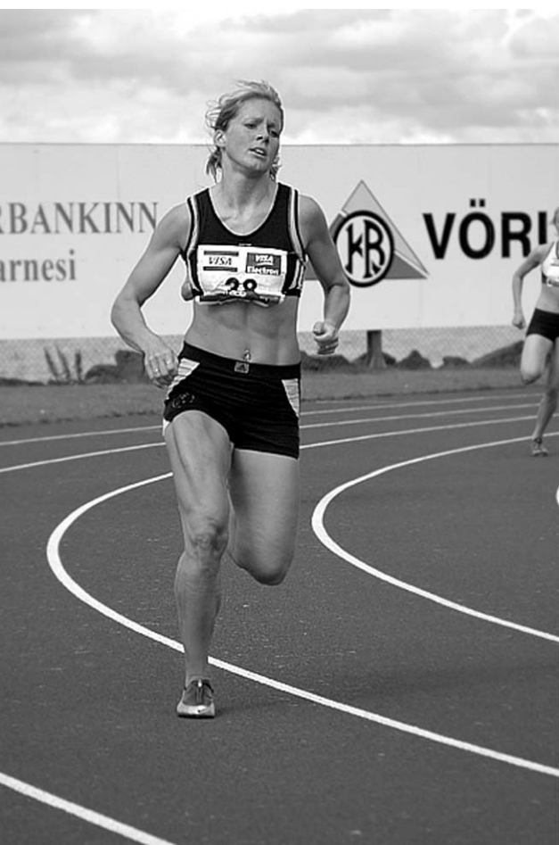
54. þing FRÍ 2004